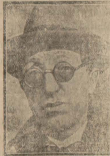
Belgradtan Dönen Hariciye Vekili Tefik Rüştü Bey

Cumhuriyetin on birinci yıl dönümünü kutlama hazırlıklarına ehemmiyetle devam ediliyor. Dün gece saat yirmide Halk Fırkasının vilâyet, kaza, nahiyeye ve ocak heyetleri büyük bir toplantı yaparak büyük bayramda fırka cephesinden yapılacak işleri tespit etmiştir.